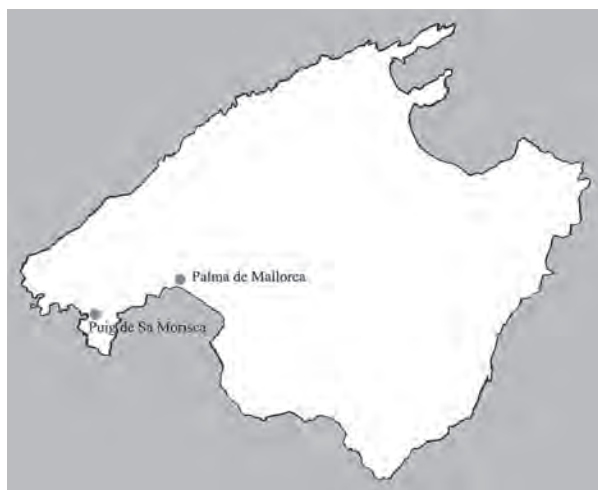
FIG. 1. Mapa de Mallorca con la indicación del yacimiento de Sa Morisca (elaboración autores).