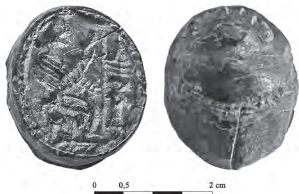
FIG. 3a. Base y esquema dorsal del escarabeo de piedra dura, probablemente nefrita gris oscuro, hallado en el yacimiento de Sa Morisca , Santa Ponça, Mallorca (según V.M. Guerrero).